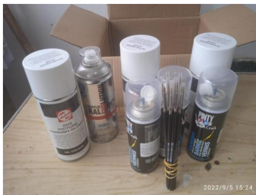
Материалы, профинансированные Музеем Берлин-Карлсхорст для реставрации картин в Городском краеведческом музее в Ахтырке.